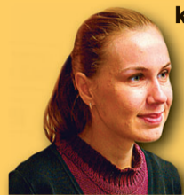
Kadri Simson, Riigikogu kesksraktsiooni esimees

Kõrge palga põhjendajad väidavad, et riigiettevõtte juhul on suur vastutus. Tõsi, kuid see ei erine ju põrmugi riigijuhtide vastutusest. Miks peaks elektrivõrgu arendamine olema kordi kõrgemalt hinnatud kui terve Eesti arendamine?