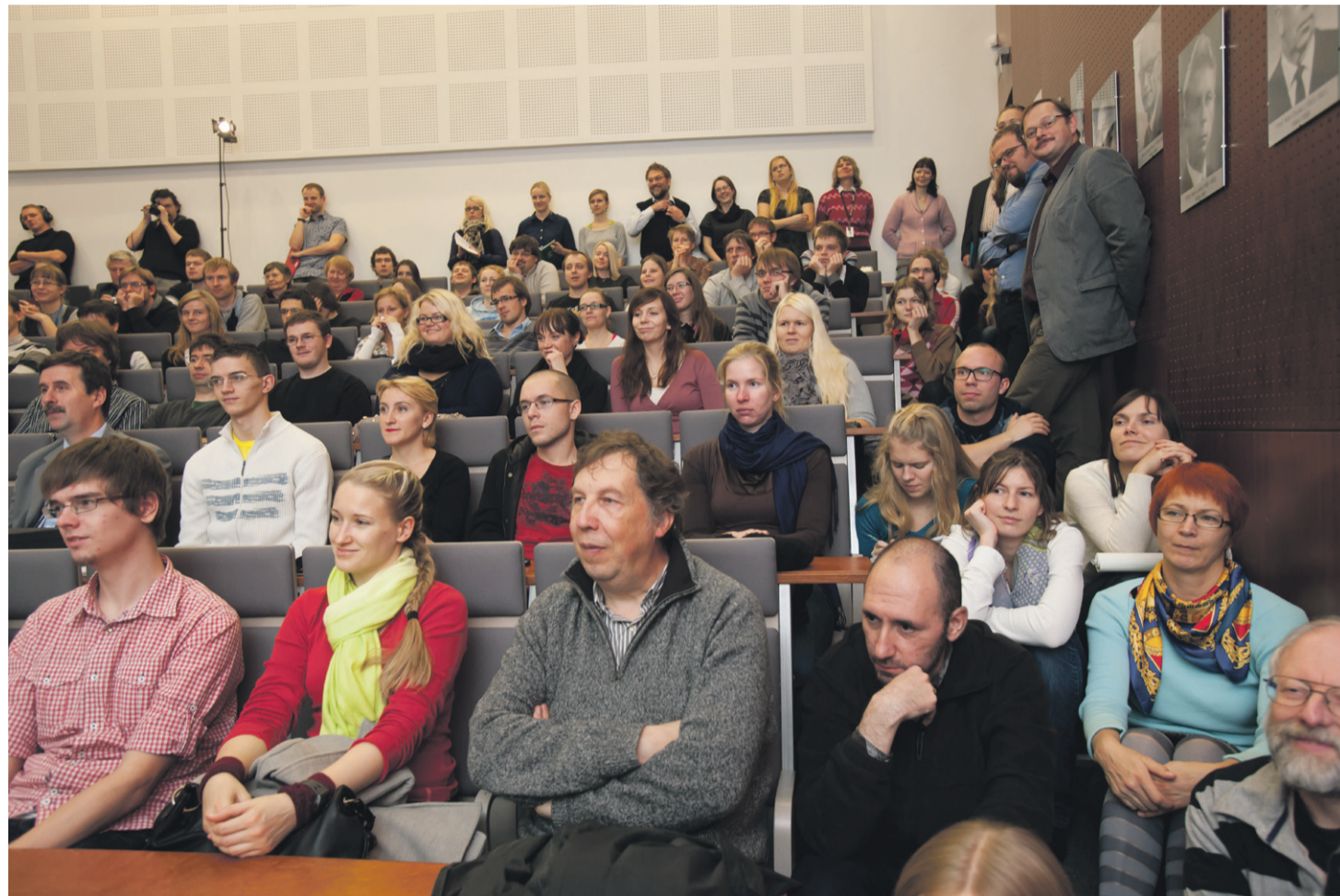
Üliõpilaskonna vanuseline struktuur on viimase viie aastaga märgatavalt muutunud. Kui traditsiooniliselt mõeldakse tudengitest rääkides hiljuti keskkooli lõpetanud noori, siis tegelikkuses ei moodusta nad üliõpilaskonnast kaugeltki nii suurt osa.